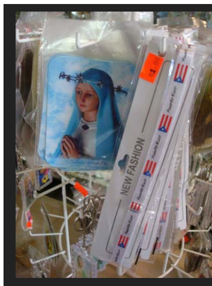
Muestra de mercancía en la “Ciudad Mística”